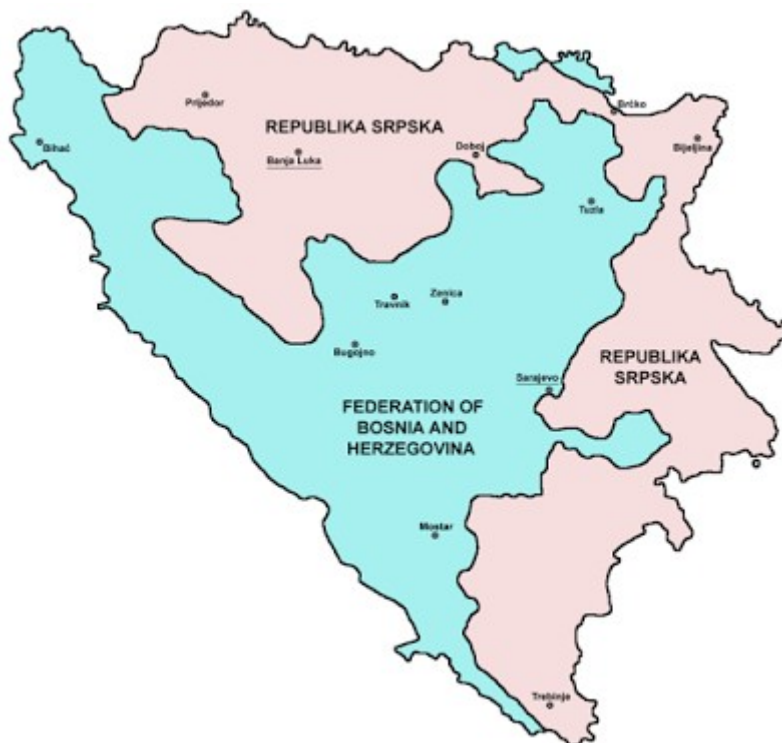
Mapa resultado de los "Acuerdos" de Dayton

La estrepitosa derrota de los serbios de Croacia ante el rodillo croata y atlantista las enormes fallos de cálculo y una inconcebible política de distensión por parte de Milosevic en medio de una guerra de exterminio nacional sellaron el destino de los serbo-bosnios que empezaron a su vez a dividirse, entre partidarios de Banja Luka y Pale que fueron instrumentalizados por EEUU. No obstante resistieron hasta el final, un final en el que Serbia fue quizá su peor enemigo. Y los acuerdos de Dayton su claudicación.