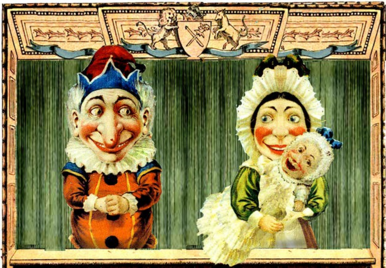
Punch y Judy, los títeres de cachiporra británicos