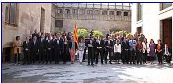
Carles Puigdemont anuncia fecha y pregunta del Referéndum de independencia de Cataluña.

El referéndum estuvo inicialmente programado para el 17 de septiembre de 2017, a pesar de que estaba excluido (lo calificaban como "pantalla pasada") de las promesas electorales hechas por los partidos independentistas antes de las elecciones catalanas de 2015 , cuyo resultado fue una mayoría parlamentaria para la coalición Junts pel Sí , junto con la Candidatura de Unidad Popular-Llamada Constituyente la cual consiguió 72 de los 135 escaños, aunque el porcentaje de votos para los partidos de la coalición fueron del 47,8%. El recién elegido Parlamento de Cataluña resolvió rápidamente celebrar un referéndum sobre la independencia, [8] [9] después de que la consulta de 2014 se hubiese reducido a un «proceso de participación ciudadana» no vinculante. Sin embargo, el Tribunal Constitucional de España anuló más tarde la resolución del Parlamento de Cataluña para celebrar la consulta. [10]