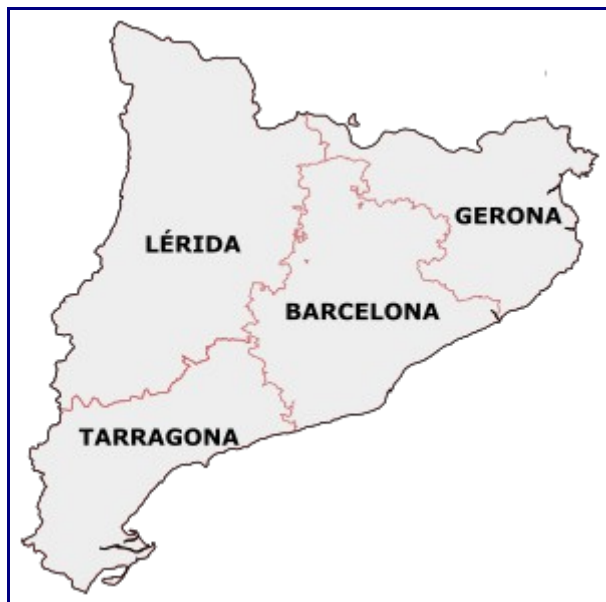
Cataluña y sus provincias