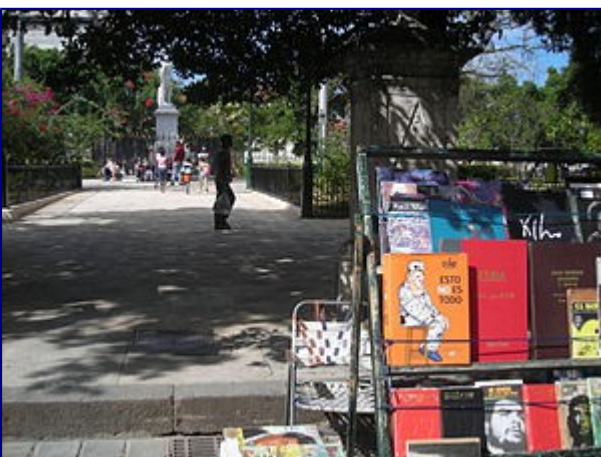
Libro "Esto no es todo" en venta en un mercado callejero de una plaza en La Habana Vieja, Cuba.