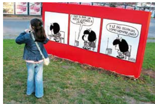
En 1995 se inauguró la Plaza Mafalda, barrio de Colegiales; ciudad de Buenos Aires

Es en ese contexto donde surge, por más de un concepto volviéndose inmediata excepción, la argentina Mafalda . De nuevo circunscribiendo el tema al ámbito espaciotemporal del México de hace unas cuatro décadas y media, poco más o menos, debe decirse que Mafalda llegó a este país integrándose a las páginas del hoy extinto diario Novedades , y debe también decirse que en principio no causó –y nada parecía sugerir que lo haría entonces ni después– mayor revuelo ni celebridad notable.