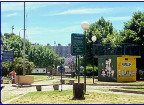
Plaza Mafalda , en el barrio porteño de Colegiales

Los protagonistas suelen ser gente normal haciendo su vida, aunque Quino no renuncia a escenas surrealistas o alegóricas (como policías arrojando valium en las bocas abiertas de manifestantes) y a las reacciones caricaturescas .