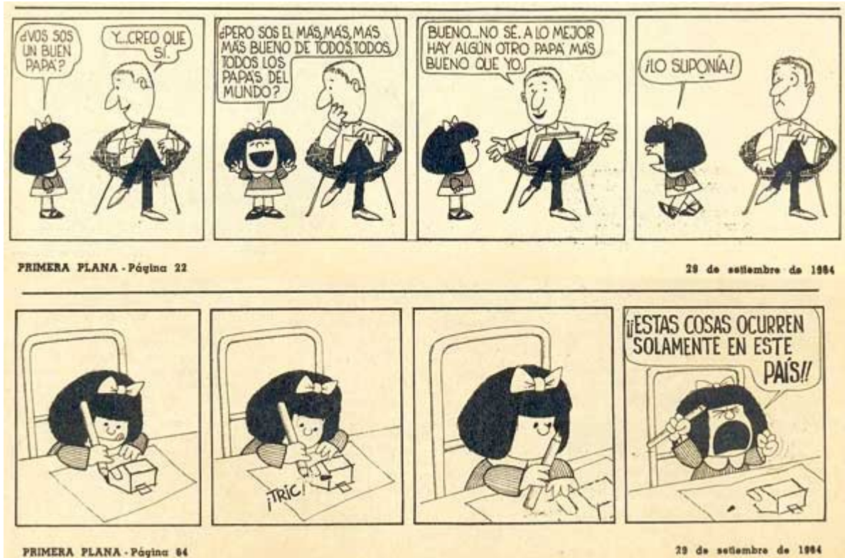
29 de septiembre de 1964. La tira Mafalda comienza a publicarse (dos veces por semana) en la revista Primera Plana. Aparecen como personajes Mafalda y su papá

Directorio Núm. Anteriores jsemanal@jornada.com.mx