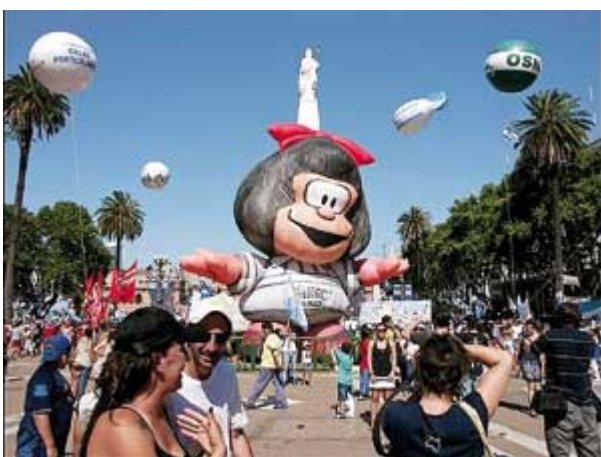
Imagen de Mafalda con leyendas de apoyo a la democracia durante la celebración del nuevo mandato de la presidenta Cristina Fernández, en la Plaza de Mayo

Lo relevante, desde luego, era su procedencia: por fin una tira cómica que no era gringa, que es tanto como decir por fin la presencia de un personaje –mejor dicho, y como todo mundo sabe, un grupo numeroso de ellos– nacido, desplegado, puesto a “vivir”, originalmente en un contexto bastante más afín al nuestro de lo que jamás podrían ser el aséptico suburbio de Charly Brown, el chabacanísimo Riverdale de Archie, ni mucho menos la Metrópolis de Clark Kent o la Gotham City de Bruce Wayne.