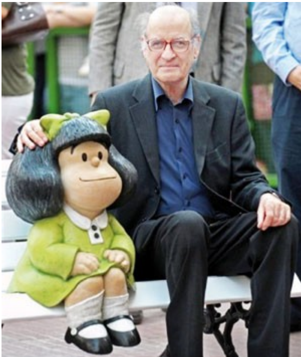
Joaquín Salvador Lavado (Quino) en 2009, inaugurando una escultura de Mafalda, a pocos metros del edificio donde vivía en el barrio de San Telmo, Buenos Aires; donde se inspiró para ambientar la historieta

Mientras el avasallamiento en la categoría de cultura popular, es decir en el cómic, era prácticamente total a consecuencia de los jamás abandonados –y muy pronto saqueados y vueltos a saquear por el cine– Supermán , Batman , El sorprendente Hombre Araña y demás “superhéroes”, pero también a causa de una constelación con menos suerte a la hora de la evocación, como Archie , La Pequeña Lulú , Periquita , Sal y Pimienta , El Pato Donald , Gasparín el Fantasma Amigable , Riqui Ricón , El Pájaro Loco ... mientras esa aplanadora de cuadernillos tamaño media carta engrapados medraba a sus anchas en los puestos de revistas –acompañados, con diversas debilidades y/o fortalezas, siempre entre varios otros por ejercicios locales como El Payo ; Susy , Historias del Corazón ; Lágrimas , Risas y Amor ; Capulinita , Kalimán , Rarotonga , así como el notable por atípico y desabrochado Chanoc –, la tira cómica contaba con una ventaja comparativa nada despreciable, consistente en venir incluida como una sección más de un diario y, por lo tanto, no implicar un desembolso económico aparte ni tampoco una búsqueda específica para su consumo. Es decir que, si bien el cómic –el tebeo en España, o “los cuentos”, como se les llegó a conocer en aquel México de dólares a doce cincuenta viejos pesos cada uno– tenía una más que demostrada popularidad, verificable en tirajes que hoy se antojan fantásticos o fantasiosos, en todo caso envidiables; y si bien dicha popularidad no estaba de ningún modo