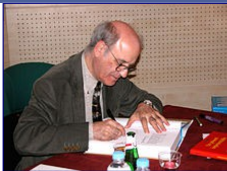
Quino, en 2004, en París