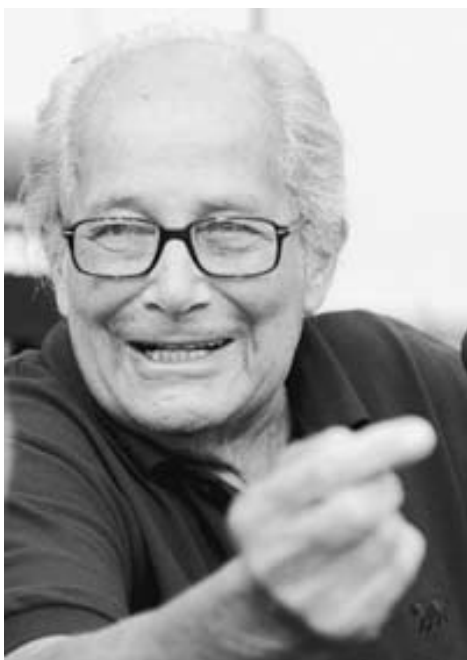
Pontecorvo filmó por última vez durante el G-8 de Génova

El director de La batalla de Argelia y Queimada , fallecido en Roma a los 86 años, estaba considerado la gran figura ética del cine italiano. Fue militante, partisano, periodista, agitador cultural y cineasta comprometido.