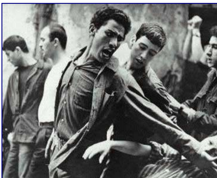
La batalla de Argel

“Queimada”, fue su tercera película en 1969. Una reflexión marxista sobre el colonialismo, ambientada en las Antillas de los principios del siglo XIX y protagonizada por un divo de la talla de Marlon Brando.