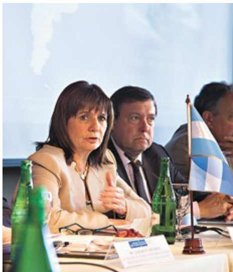
na03fo02.jpg9qc9bv.jpg, image/jpeg, 232x269

Jueves, 18 de febrero de 2016 | “Queremos cambiar la cultura del corte, no vamos a tolerar la extorsión, los vamos a escuchar, pero no permitiremos que la calle sea un caos.” La frase volvió a ser pronunciada ayer en Bariloche por la ministra de Seguridad, Patricia Bullrich, tras la reunión del Consejo de Seguridad Interior donde finalmente se aprobó el Protocolo de Actuación de las Fuerzas de Seguridad del Estado en Manifestaciones Públicas. Según el texto que difundió el ministerio, las fuerzas policiales y de seguridad “procederán a intervenir y a disolver” las manifestaciones. A poco de ser difundida la noticia resurgieron repudios a esta medida que pretende condicionar y penalizar la protesta social. En el nuevo texto no hay mención alguna a la prohibición del uso de armas de fuego, como sí había en el protocolo implementado por el anterior gobierno en 2011.