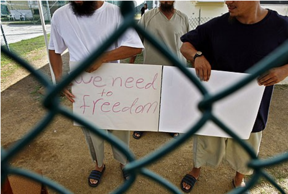
Presos uigures retenidos en Guantánamo, con un cartel en el que reclaman su liberación