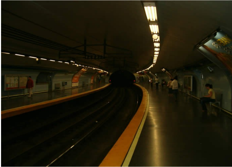
Andén de metro