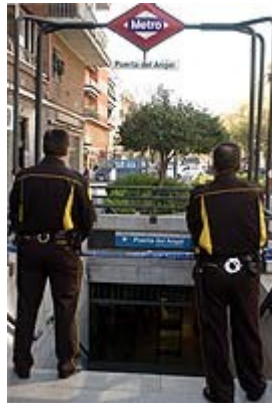
EL personal de seguridad custodia el acceso a la estación (Foto: Efe). (Efe)

Dos personas murieron y otras dos resultaron heridas en la madrugada del lunes como consecuencia de un choque entre dos vagones del metro, que no trasladaban viajeros sino carga, en las vías de la estación Puerta del Ángel , de la línea 6 del suburbano de la capital.