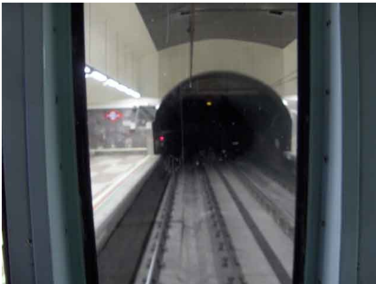
Tunel de línea 1

Aun así los trabajadores del metro cuentan muchas curiosidades referentes a los largos y oscuros túneles. El Metro oculta historias realmente escabrosas, como ser uno de los lugares en los que más suicidios se producen de la capital, estamos hablando de aproximadamente unos ochenta casos al año.