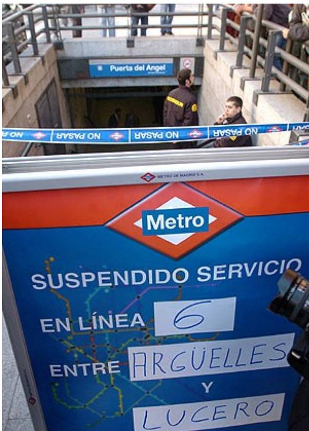
Un cartel en la boca de Metro de Puerta del Ángel anuncia el corte.