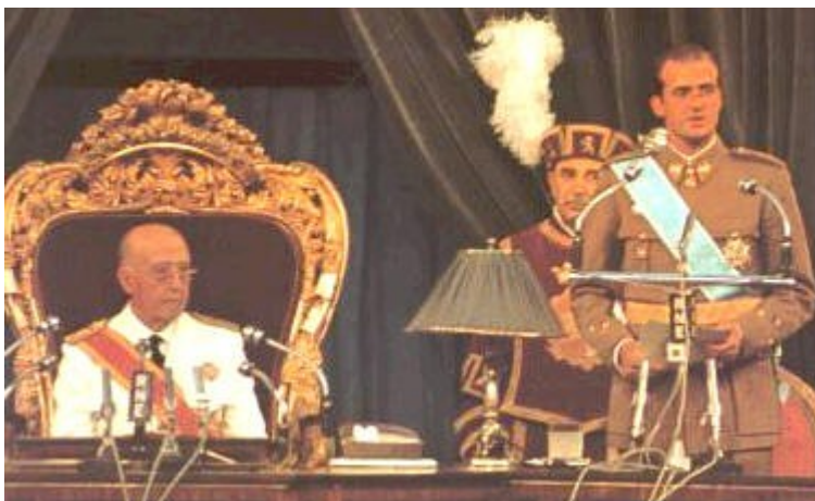
Juan Carlos de Borbón, aceptaba la sucesión de Franco en la Jefatura del Estado a título de rey. 23 de julio de 1969.

En enero de 2006, cuatro meses después del envío del Informe sobre el 23-F al presidente del Congreso de los Diputados y visto que éste no parecía dispuesto a acusar recibo del mismo y, mucho menos, a estudiarlo o debatirlo en la Cámara que presidía (aunque me consta que dio traslado del escrito a los diferentes grupos parlamentarios) decidí enviar el prolijo documento al presidente del Senado, señor Rojo, al del Gobierno de la nación, señor Rodríguez Zapatero , y a cada uno de los presidentes de las más altas instituciones del Estado: Consejo General del Poder Judicial, Tribunal Supremo, Tribunal Constitucional, Consejo de Estado... etc, etc. Ninguna de las autoridades a las que iba dirigido el, al parecer, "políticamente incorrecto" escrito (a excepción del presidente del Senado, quien acusó recibo a través de la Comisión de Peticiones de la Cámara) contestó al mismo.