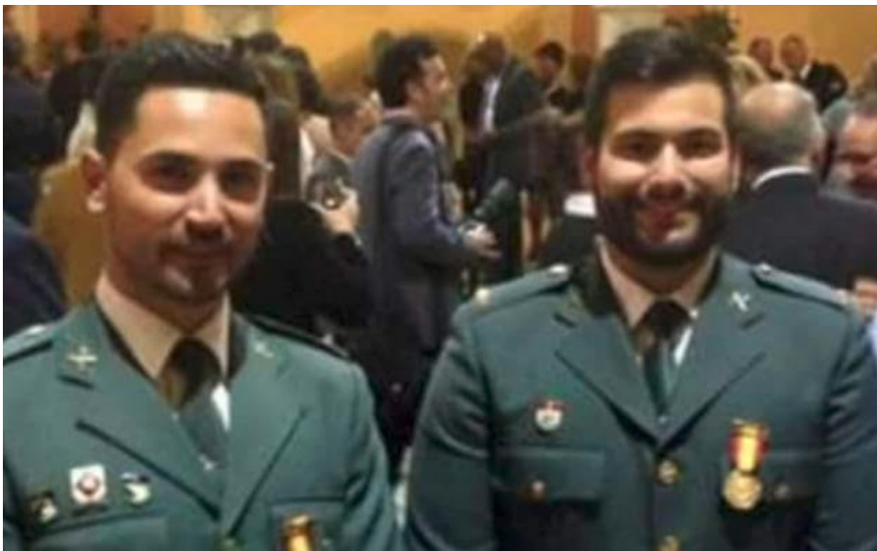
El teniente y el sargento supuestamente apalizados.