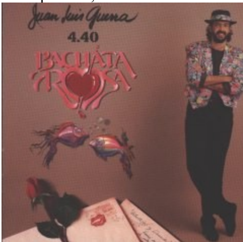
Rosalía (Juan Luis Guerra)

Bachata rosa Rosalía Como abeja al panal Carta de amor Estrellitas y duendes A pedir su mano La bilirrubina Burbujas de amor Bachata rosa Reforéstame Acompáñeme, civil