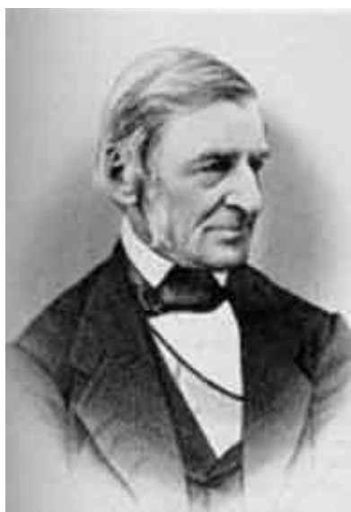
Ralph Waldo Emerson

Debemos amar a nuestra patria como a nuestros padres, We must affect our country as our parents, y si alguna vez permitimos And if at any time we alienate que nuestro amor o nuestras obras dejen de honrarla, Our love or industry from doing it honor, debemos tener en cuenta los efectos y enseñar al alma We must respect effects and teach the soul cuestiones de consciencia y religión Matter of conscience and religion, y no deseos de poder o lucro. And not desire of rule or benefit.