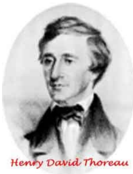
Henry David Thoreau

Descendiente de inmigrantes franceses, nace el 12 de julio de 1817 Henry David Thoreau en Concord, Massachusetts; la ciudad que fue el sitio de las primeras batallas de la guerra de independencia de los Estados Unidos, en Lexington precisamente el 19 de abril de 1775 y que posteriormente iba a ser -gracias a Emerson y al mismo Thoreau- la cuna del renacimiento cultural de Nueva Inglaterra.