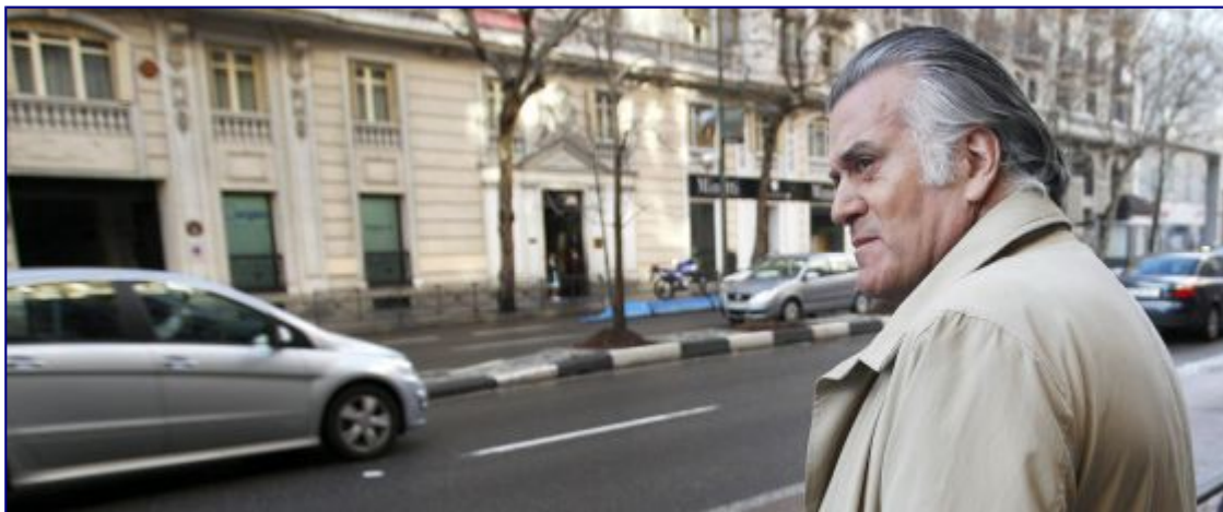
Barcenas, a la salida de su casa de Madrid.