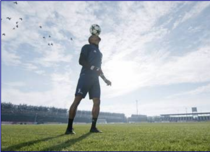
Las plataformas digitales calientan antes del Mundial