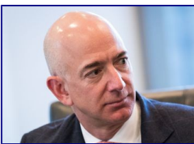
Amazon supera a Google y se convierte en la segunda empresa más valiosa