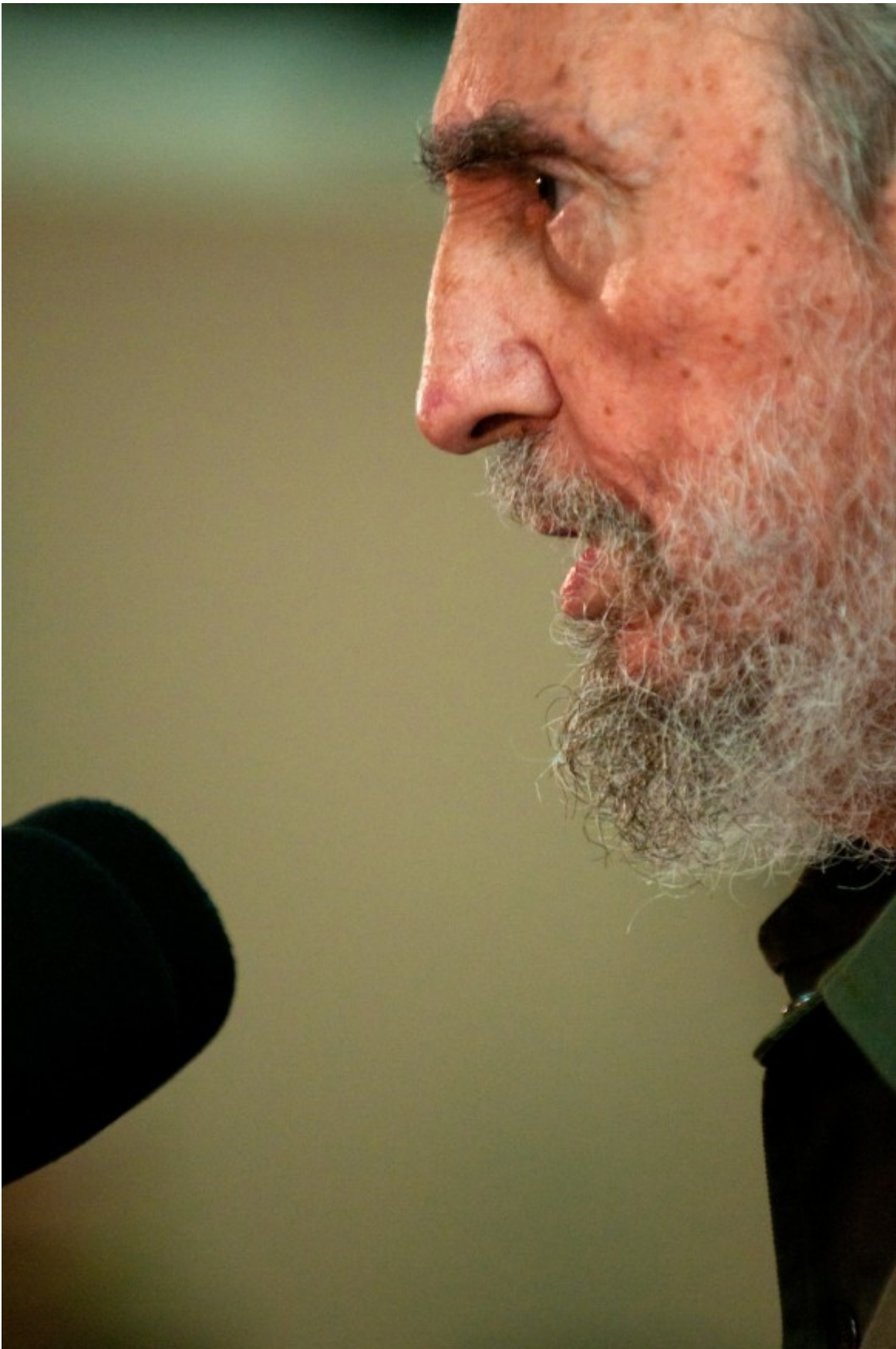
Fidel recibe a la Brigada Moto Méndez.