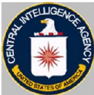
William Colby (1920-1996). Director de la CIA murió de manera misteriosa cuando pescaba en su bote después de que se jubiló de la CIA.

Rastrear la historia de la creación y formación del más secreto de los servicios secretos no sólo