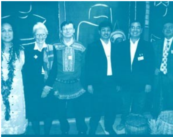
Algunos miembros del foro Permanente durante su primera sesión en 2002

Cuando el Foro Permanente para las Cuestiones Indígenas se reunió por primera vez en las Naciones Unidas en mayo de 2002, fue un momento histórico para el gran número de personas que habían trabajado durante años para convertir el Foro en realidad. Se cumplía así su deseo de que los pueblos indígenas pudieran hablar por sí mismos en una nueva forma, y presentaran sus opiniones como miembros de pleno derecho de un órgano de las Naciones Unidas.