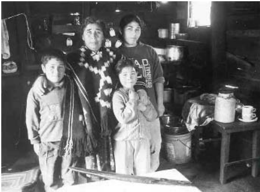
ASOCIACION INDIGENA PARA LA SALUD MAKEWE PELALE HOSPITAL MAKEWE